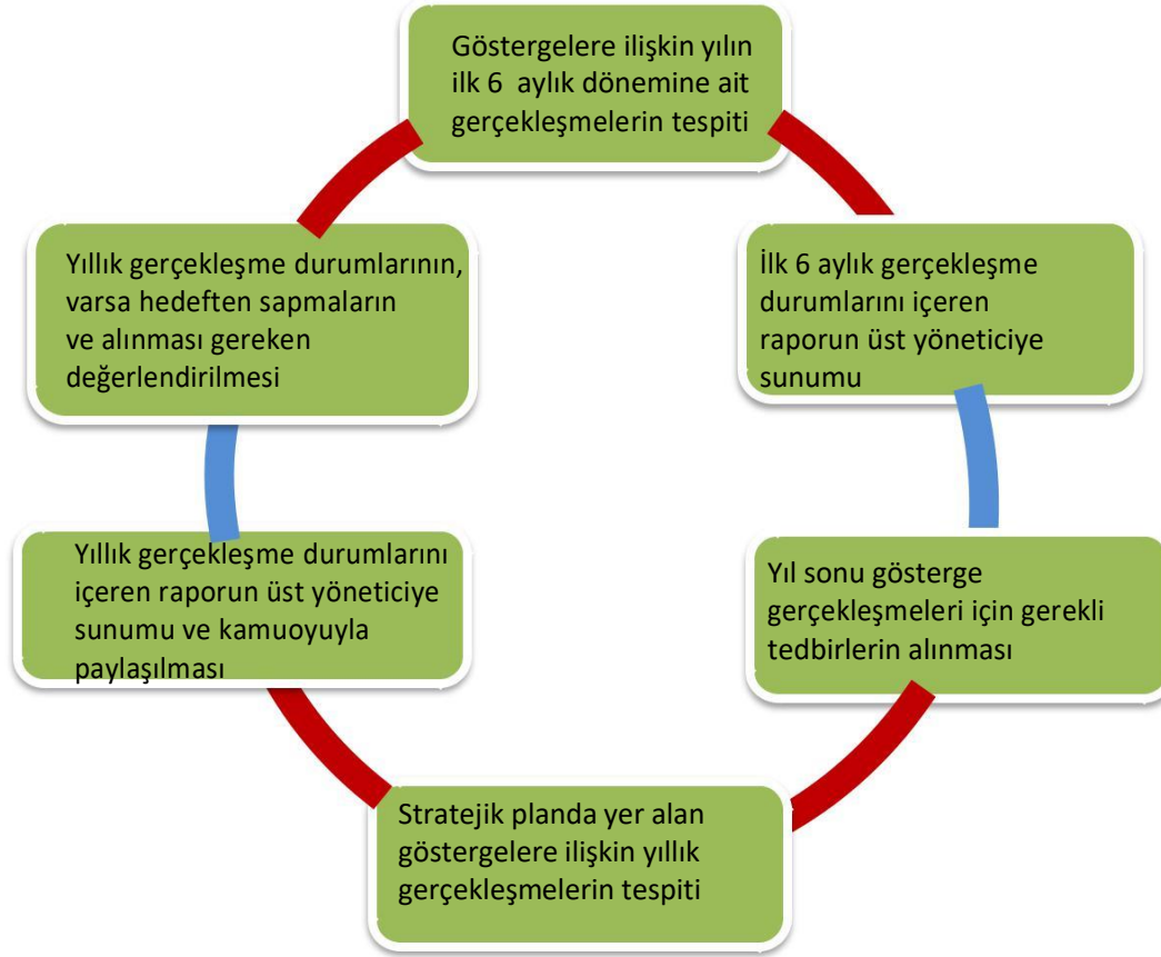
2019-2023 Stratejik Planı İzleme ve Değerlendirme Modeli